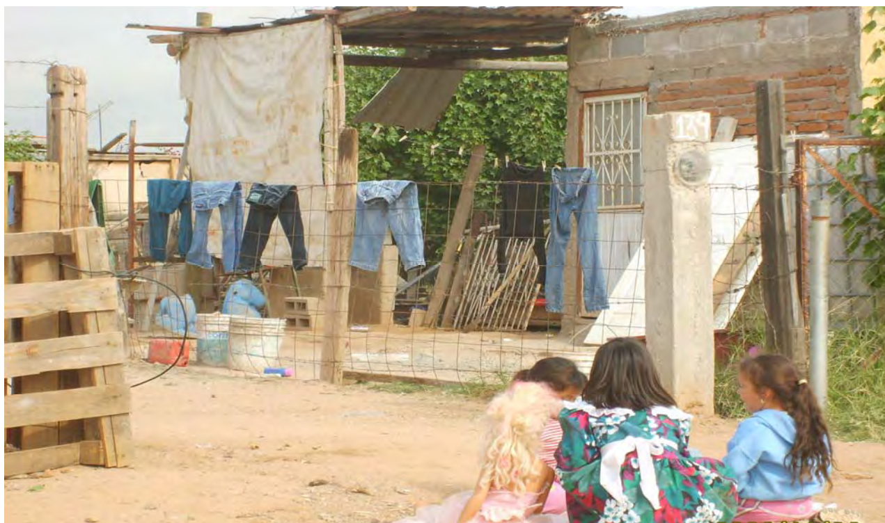
“Tres niñas juegan en la calle con sus muñecas aprovechando un día nublado del mes de noviembre”