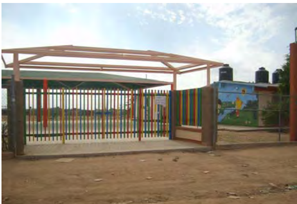
Escuela Primaria “Alfonso Ortiz Tirado y Kinder Nueva creación”

“Al interior de la comunidad cuentan con equipamiento como escuela primaria, kinder, centros de salud y pequeños comercios familiares”