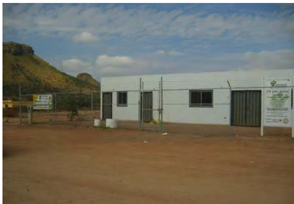
Centro de Desarrollo Comunitario “Don Juan Navarrete”

“La composición del asentamiento es bastante heterogéneo”