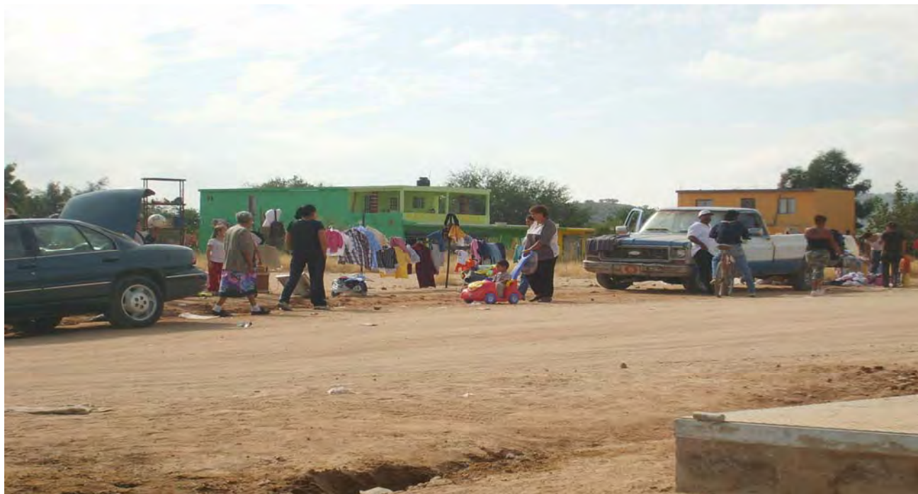
“Algunos vecinos del asentamiento aprovechan los domingos para vender ropa usada en una de las calles principales del asentamiento y obtener un dinerito extra que los ayude con sus gastos diarios”